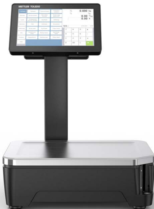
Váha FreshBase Tower

Osvědčená funkčnost a působivý poměr ceny a výkonu: váhy řady FreshBase představují zcela novou řadu vah určenou do prodejen potravin, které se chystají k přechodu na rychlejší vážení s využitím pohodlného ovládání na dotykovém displeji.